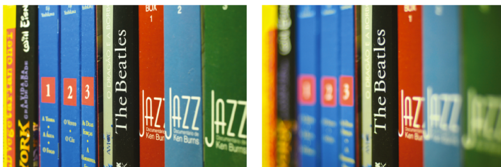
Efeito do Diafragma

O diafragma colabora para deixar o fundo da imagem mais ou menos nítido. A paridade de objetiva e de distância entre a câmera e o sujeito a escolha do valor do diafragma afeta quanto elementos disposto em diferentes planos da imagem apareçam definidos e com detalhes legíveis.