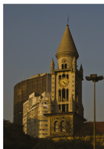
Falta de Luz Foto escura