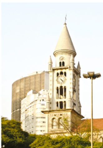
Excesso de luz Foto clara